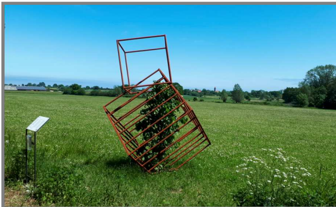
„ Baum - Mensch - Baum “ - Eisen-Installation mit Winterlinde für Hof Bokhorst Standort: Dahmer Weg zwischen Dahme und Kellenhusen Künstlerin: Margit Huch - Postfeld