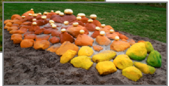
„ Bodenpunkte “ - Findlingskulptur auf dem Reiterhof Hoppe in Lenste, Langenredder 48

Standort: Salzwiese zwischen Lenste und Lenster Strand