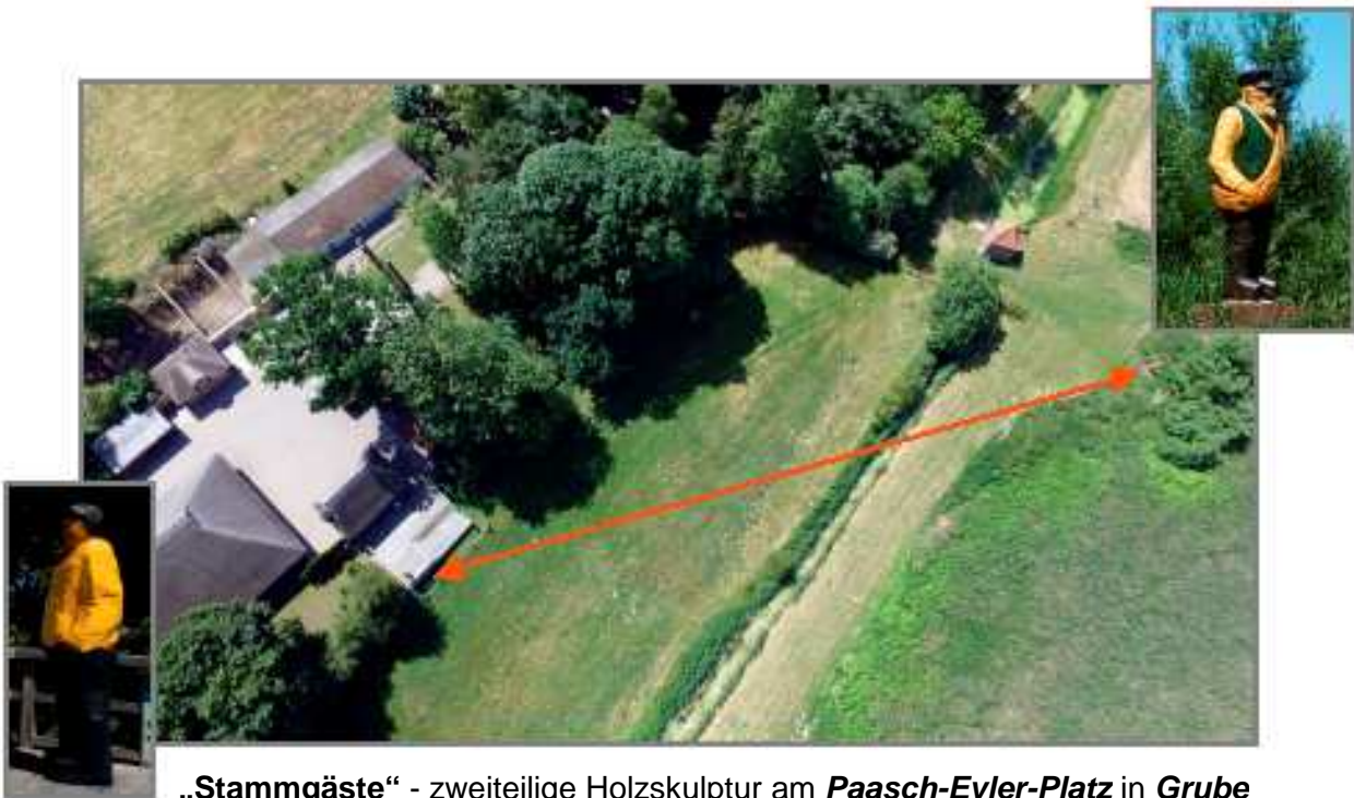
„ Stammgäste “ - zweiteilige Holzskulptur am Paasch-Eyler-Platz in Grube Standort: Aussichtsplattform und ca. 75m entfernt am Oldenburger Graben Künstler: Johannes Caspersen - Flensburg